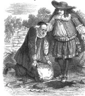
Gravadura de J.J. Grandville