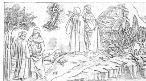
Gravadura de Boticelli

Bartolomeu Zorzi, lo genovés Bonifaci Calvo, lo mantovan Sordel, que devián èstre los predecessors e mèstres de sant Francés d'Assisi e dels poètas de « Dolci stil nuovo ».