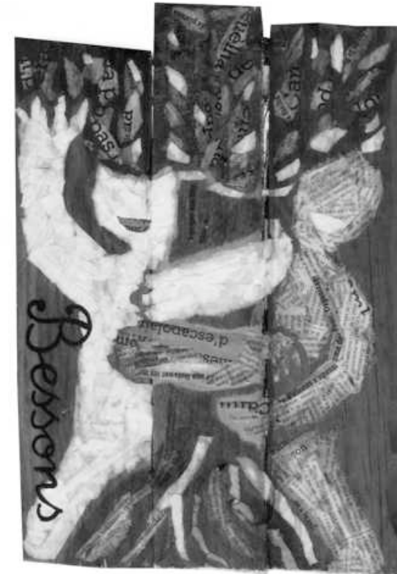
« Los Bessons » ZODIAQUE D'ÒC

16 rue de Pujols 47300 VILANUEVA d'ÒUT Tel & fax : 05 53 41 32 43 Corrièl : eoe@wanadoo.fr Site : www.eoe-oc.org